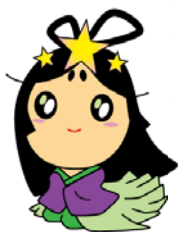
交野市産業PRキャラクター おりひめちゃん

緑豊かな里山の自然環境と共存し、子育てや教育環境の充実を図り、住みたい、住み続けたいまちづくりを進めている交野市と、植物を有用な資源として収集・保存し、教育・研究利用をはじめ、生物多様性の理解促進のため展示・公開するなど地域貢献に取り組む市大植物園が、同じ環境の中で、目標に向かって連携・協力し、豊かな将来のために市民サービスの一層の向上をめざします。