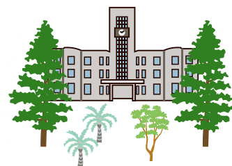
都市型総合大学の 『森の植物園』

緑豊かな里山の自然環境と共存し、子育てや教育環境の充実を図り、住みたい、住み続けたいまちづくりを進めている交野市と、植物を有用な資源として収集・保存し、教育・研究利用をはじめ、生物多様性の理解促進のため展示・公開するなど地域貢献に取り組む市大植物園が、同じ環境の中で、目標に向かって連携・協力し、豊かな将来のために市民サービスの一層の向上をめざします。