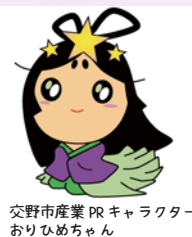
交野市産業 PR キャラクター おりひめちゃん