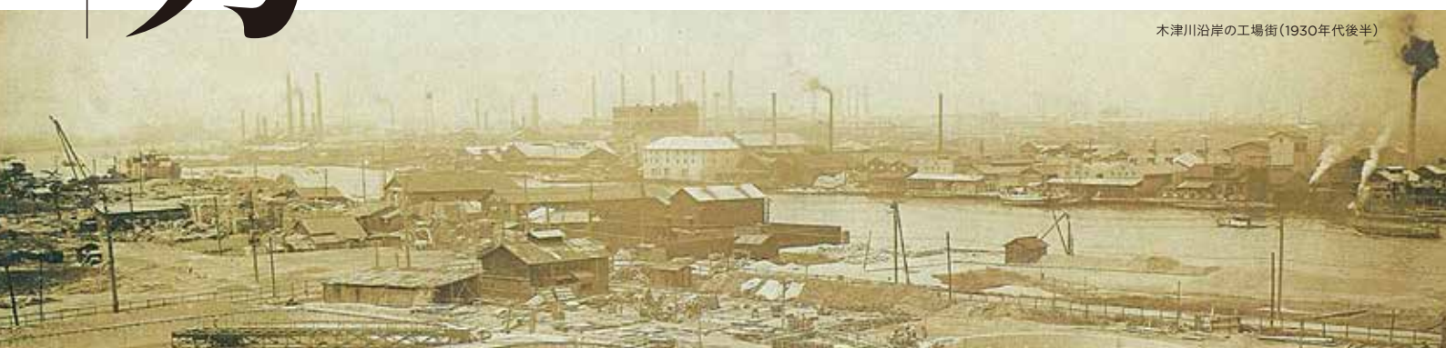
木津川沿岸の工場街(1930年代後半)