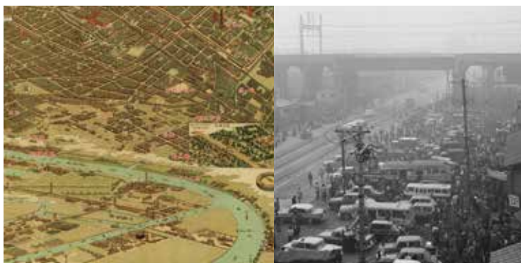
写真左: 大阪市パノラマ地図鳥瞰部分(1923年)/右: 釜ヶ崎、あいりんの地力・磁力をまざざとみせつける(1964年頃)

西成エリアの密な鉄道路線の形成は、いずれも広義の「ミナミ」と称される地区を起点にしたものである。大阪の「ミナミ」と「キタ」は古くからの繁華街を意味する用語として広く知られてきた。しかし、その形成が鉄道路線の起点と密接に関わっていることは意外に見落とされてきたように思われる。そこで、「ミナミ」と「キタ」の成立を対比させながら、その通過点としての西成エリアの鉄道路線形成をお話をする。