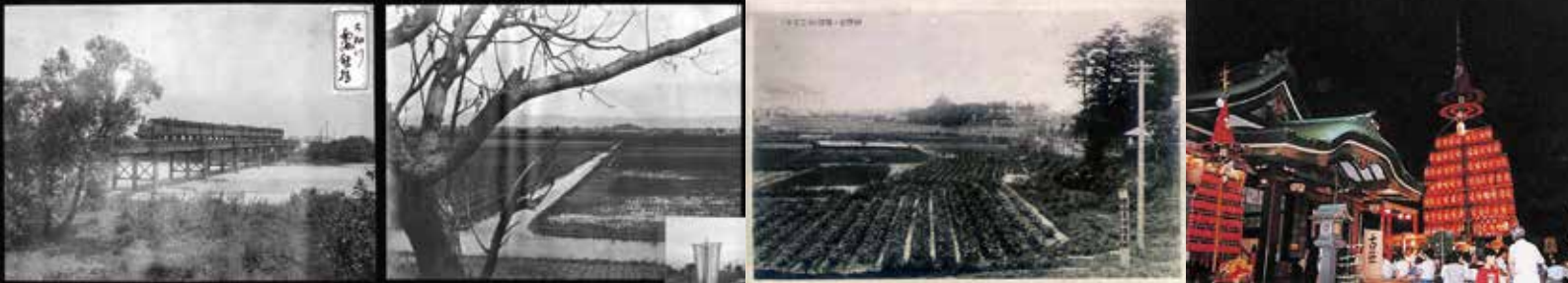
写真左から、大和川の鉄橋をわたる南海鉄道の列車(1900年頃)/津守新田から天下茶屋方面を望む(1910年頃)/現山王3丁目から北方を望む(1916年)/玉出生根神社の夏祭りにたてられる「だいがく」(1995年)