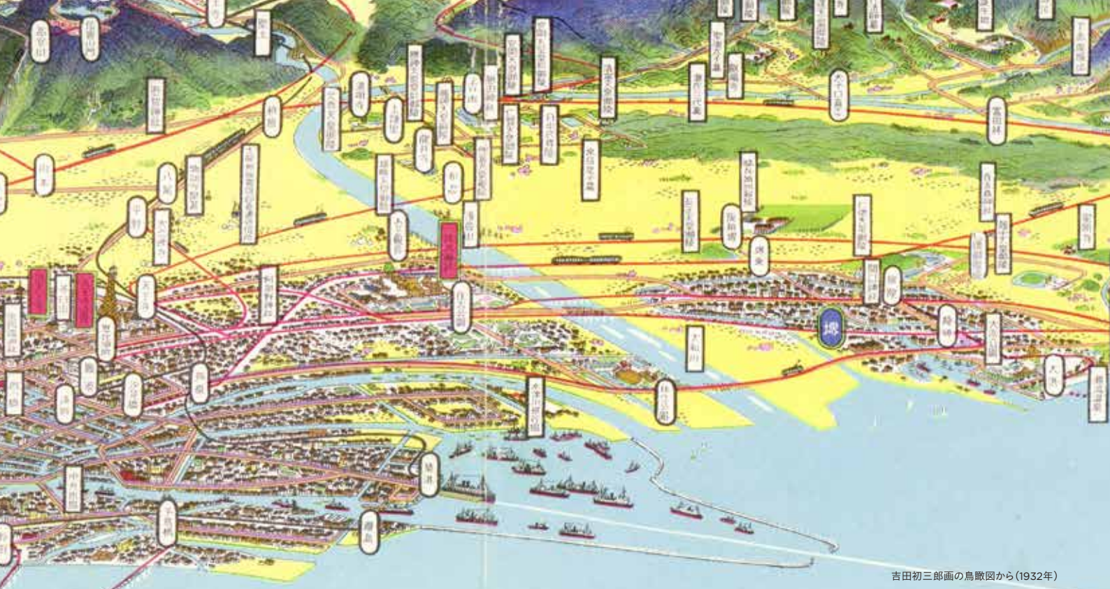
吉田初三郎画の鳥瞰図から(1932年)