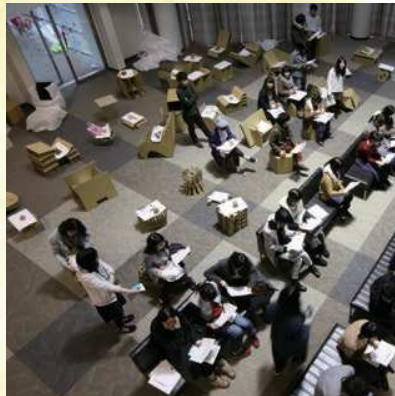
△学部1年後期課題：座るカタチ