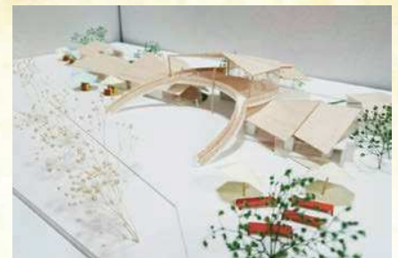
△学部3年前期課題：文化複合施設