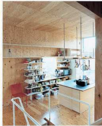
△コモンキッチン (写真：平野太呂)