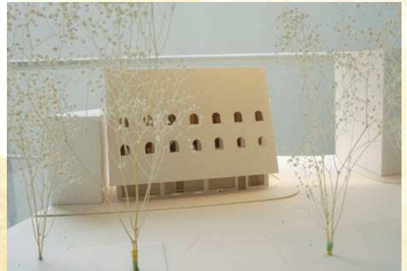
△学部2年前期課題：都市に住む