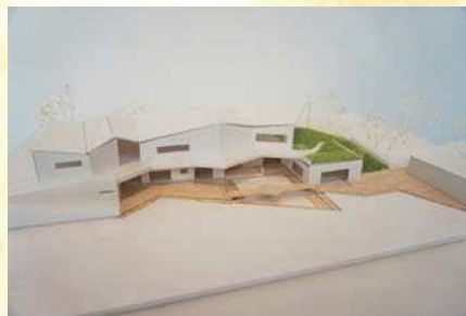
△学部2年後期課題：地域に開かれた保育園