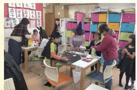
△学部3年後期課題：建築計画基礎演習