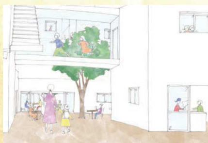
△学部3年後期課題：集合住宅