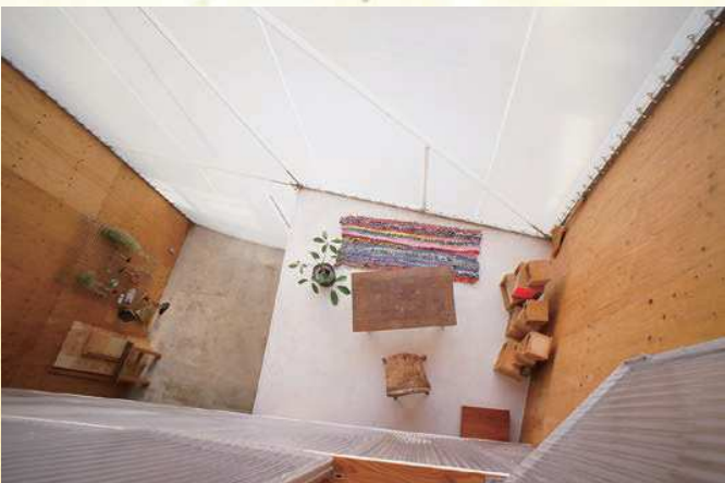
△リビングより吹抜けを見下ろす