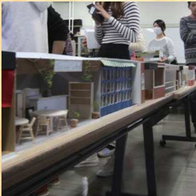
△学部1年後期課題：通りのカオ

居住環境デザインフォーラムでは、大阪市立大学生活科学部居住環境学科・大学院生活科学研究科による課題制作・実践活動の成果を展示・発表しています。