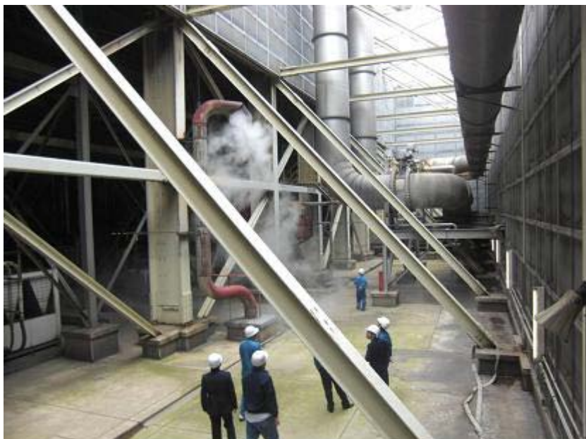
▲ ミスト散布予定場所