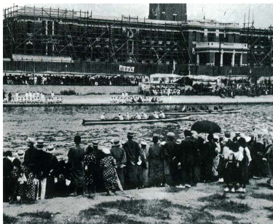
<1914 (大正 3 年) のボートレースのようす>

大阪市内復帰を果たしたボート祭関係者や卒業生の喜びようは新聞にも取り上げられたほどでした。市内復帰後の大会には、当時の大阪瓦斯社長・安田博氏など、財界で活躍していた卒業生のはからいで、大阪瓦斯や松下電器産業(当時)の社員の皆さまも応援団として会場に繰り出しました。