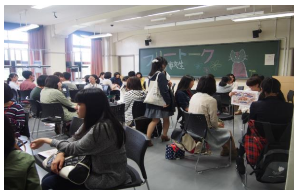
今年の春に実施した市大授業の様子