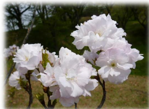
香りを分析した桜 (品種名：天の川)