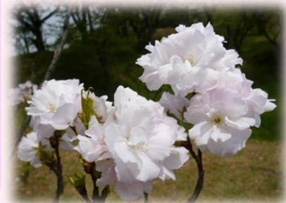
香りを分析した桜 (品種名: 天の川)