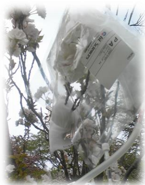
香りの捕集風景