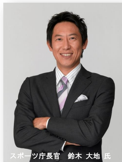
スポーツ庁長官 鈴木 大地 氏