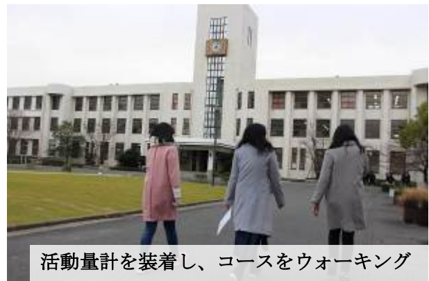
活動量計を装着し、コースをウォーキング