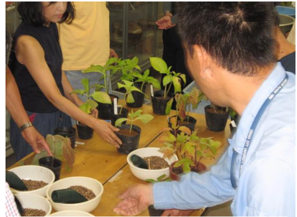
昨年の様子 (2回目：根が付いたアジサイの鉢上げ)