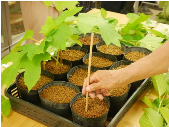
昨年の様子 (1回目：挿し木したアジサイ)

この講座では、植物園の職員がアジサイの増殖作業(挿し木)と定植作業(鉢上げ)を実際にも実演して見せ、同じことを実体験いただき、参加者のみなさんに学んでいただくという体験型の教室です。定植作業後の挿し木で根付いたアジサイは持って帰っていただけます。