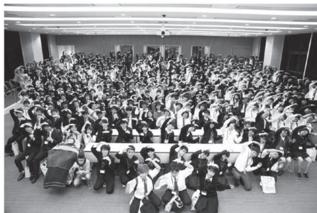
参加者全員が集まってグランドコンテストのGCマーク!!

過去最多124チームのエントリーがあり、最終選考会には2日間で約1,000人もの参加がありました。