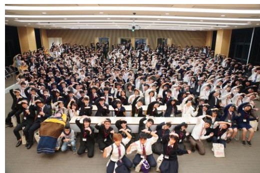
全国から集合した参加者たち（第15回）