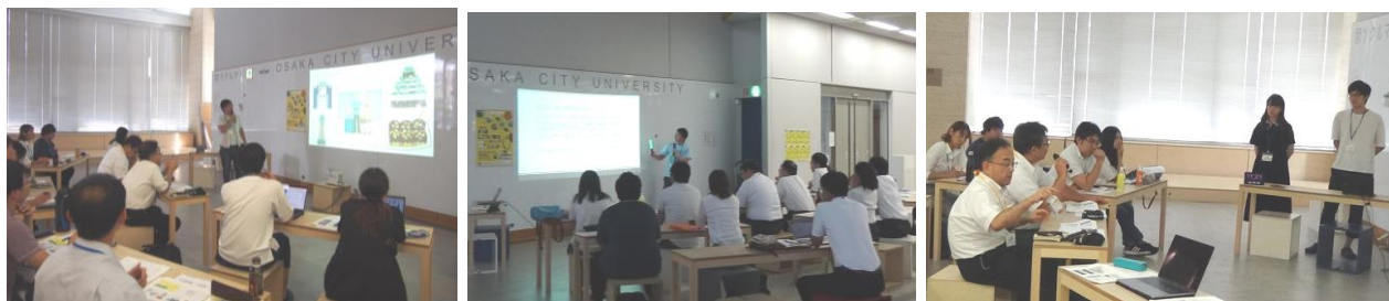
中間報告会（2019年9月11日開催）の様子

大阪市立大学の通学インフラでもあるJR大阪環状線・阪和線(天王寺～日根野～関西空港)沿線において、地域課題を解決し、または地域を活性化させ、まちのにぎわいを創出することに関する、既存概念にとらわれない学生ならではの新しいアイデアを募集するコンテストです。参加資格は大阪市立大学の学生・院生とし、初開催となる今回は8組のエントリーがありました。9月の中間報告会を経て、最終アイデアが発表されます。