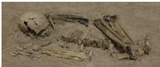
森の宮遺跡 3次3号人骨（大阪市指定文化財）

展示物のみどころは、古人骨、大阪平野の地下断面図、古文書などで、大学史に関する資料、大阪の自然と歴史に関する理系・文系の学術標本の一部について、大阪と関わりがある資料を中心に100点に近い展示物をご覧いただけます。