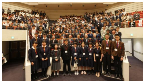
全国から集合した参加者たち (第16回・会場開催)