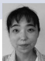
(在)河野 あゆみ KONO Ayumi 教授

研究シーズ : 学生の自己学習力と教授方略、労働職場環境と就業継続、血液透析医療と患者・家族のQOL キーワード : 自己学習力、教授方略、継続教育、アクティブ・トラંジション、労働職場環境、慢性疾患患者、QOL