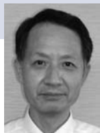
今中 基晴 IMANAKA Motoharu 教授

研究シーズ : 産婦人科感染症、周産期医学、更年期医学、不妊、産婦人科漢方、セクシュアリティなどに関する研究 キーワード : ホルモン補充療法、漢方、性感染症、不妊、前期破水